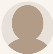
台湾から パネリスト招聘を 調整中

1941年京都市生。64年早稲田大学政経学部卒、朝日新聞社入社。68年から防衛庁担当。82年朝日新聞編集委員。著書多数。